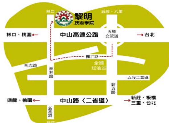
黎明技術學院交通位置圖

(2) 北二高(國道3號):由中和交流道往西經64號東西快速道路(思源路)左轉→台二線省道→右轉泰林路約2.8公里到本校正門。